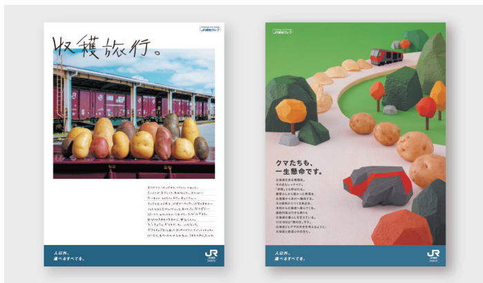
Project JR貨物北海道支社 新聞広告