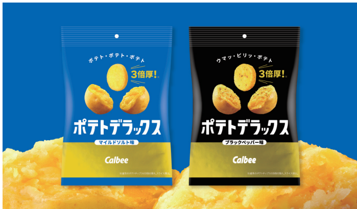
Project ポテトデラックス