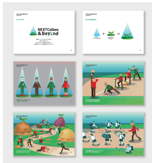
Client カルビー株式会社