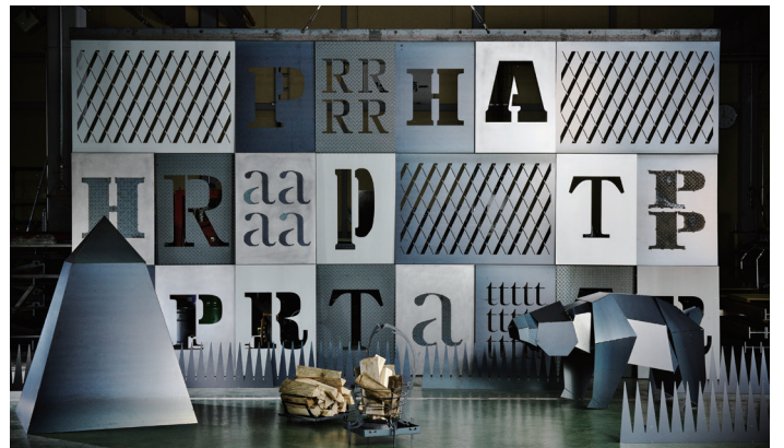
Project TRIPATH PRODUCTS