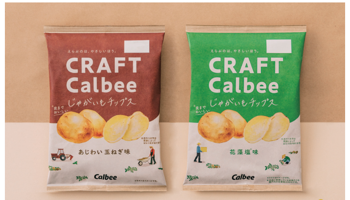
Project CRAFT Calbee じゃがいもチップス