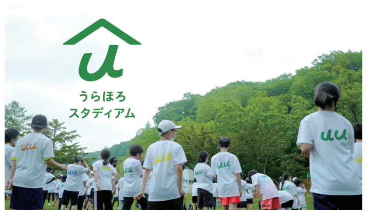
Project うらほろスタジアム