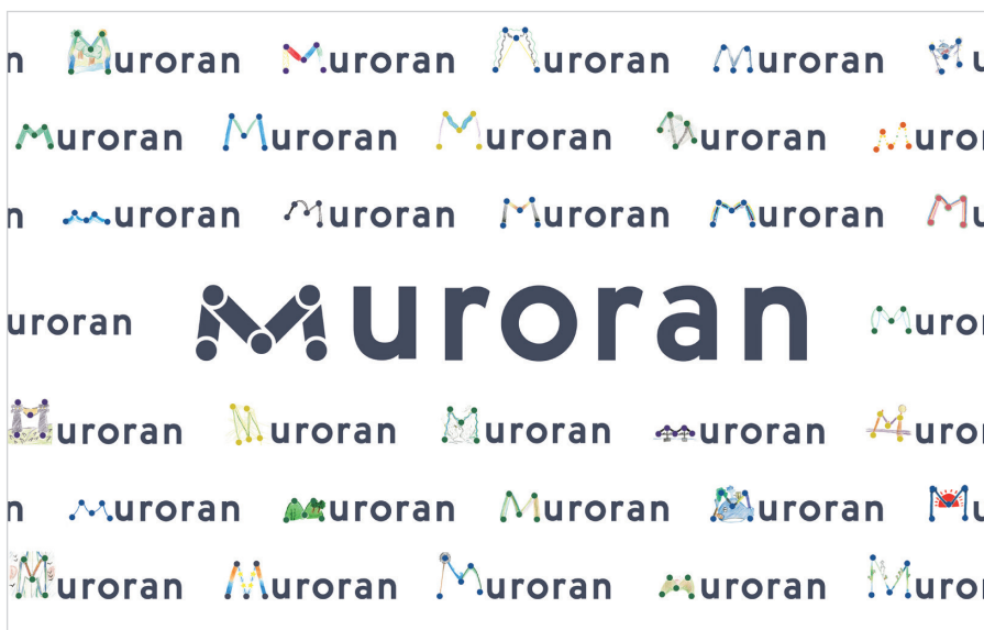
Project 室蘭市のまちイメージづくり