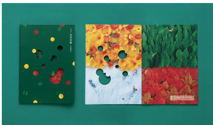
Project 北邦学園40周年事業