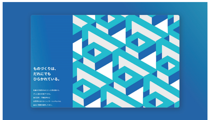
Project AGENDA TIMES RECRUITING