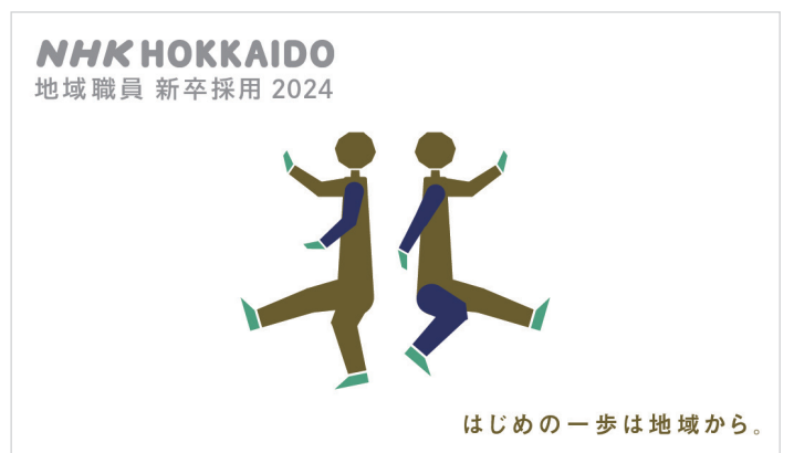
Project NHK北海道 採用サイト