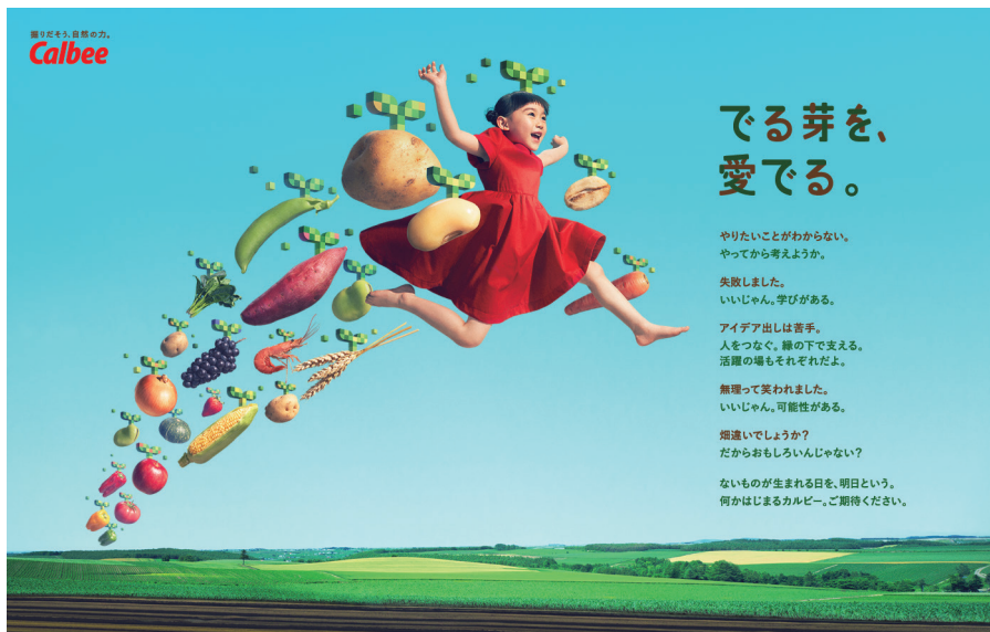
Project NEXT Calbee & Beyond